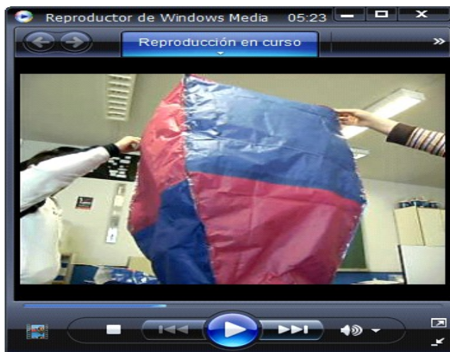
Figura 3.- Imagen del vídeo "Globo aerostático"

disminuirá su densidad respecto a la densidad del aire más frío cercano al suelo y ascenderá. En esta experiencia el alumnado de Secundaria puede aplicar su conocimiento del principio de Arquímedes a un caso real donde se diseña un globo aerostático y donde el éxito se consigue si se ha comprendido bien el citado principio.