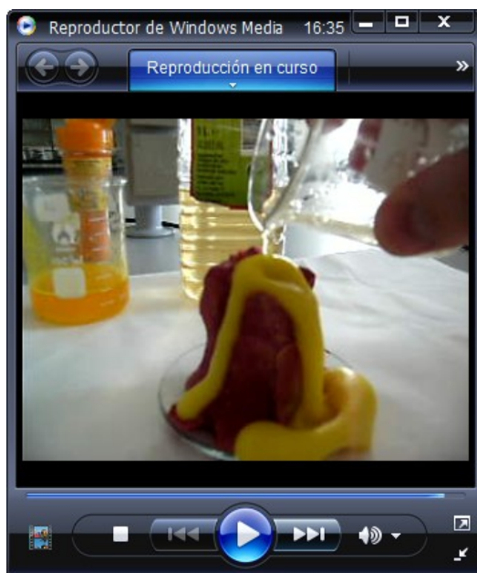
Figura 4.- Imagen del vídeo "Erupción volcánica"