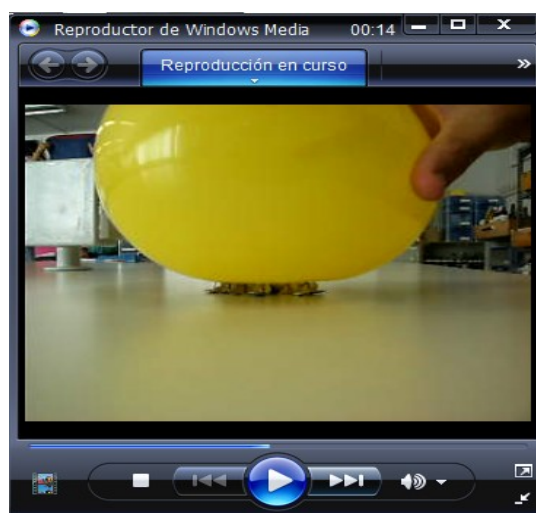
Figura 2.- Imagen del vídeo "Globo faquir".

Sorprendente presentación del concepto de presión (Figura 2). El efecto deformador de una fuerza no depende sólo de la intensidad de la misma, sino que también depende de la superficie sobre la que se aplica. Este hecho lo tenemos muy en cuenta a la hora de clavar un clavo golpeando su cabeza y no su punta. En nuestro experimento aplicamos una fuerza que se reparte en la superficie ocupada por las 20 chinchetas y la presión no es suficiente para pinchar el globo, sin embargo si aplicamos la misma fuerza sobre la superficie que ocupa una sola chincheta la mayor presión sí será suficiente para pinchar el globo. El experimento es útil en Secundaria para justificar la necesidad de introducir la presión como magnitud que completa lo explicado hasta entonces por la magnitud fuerza.